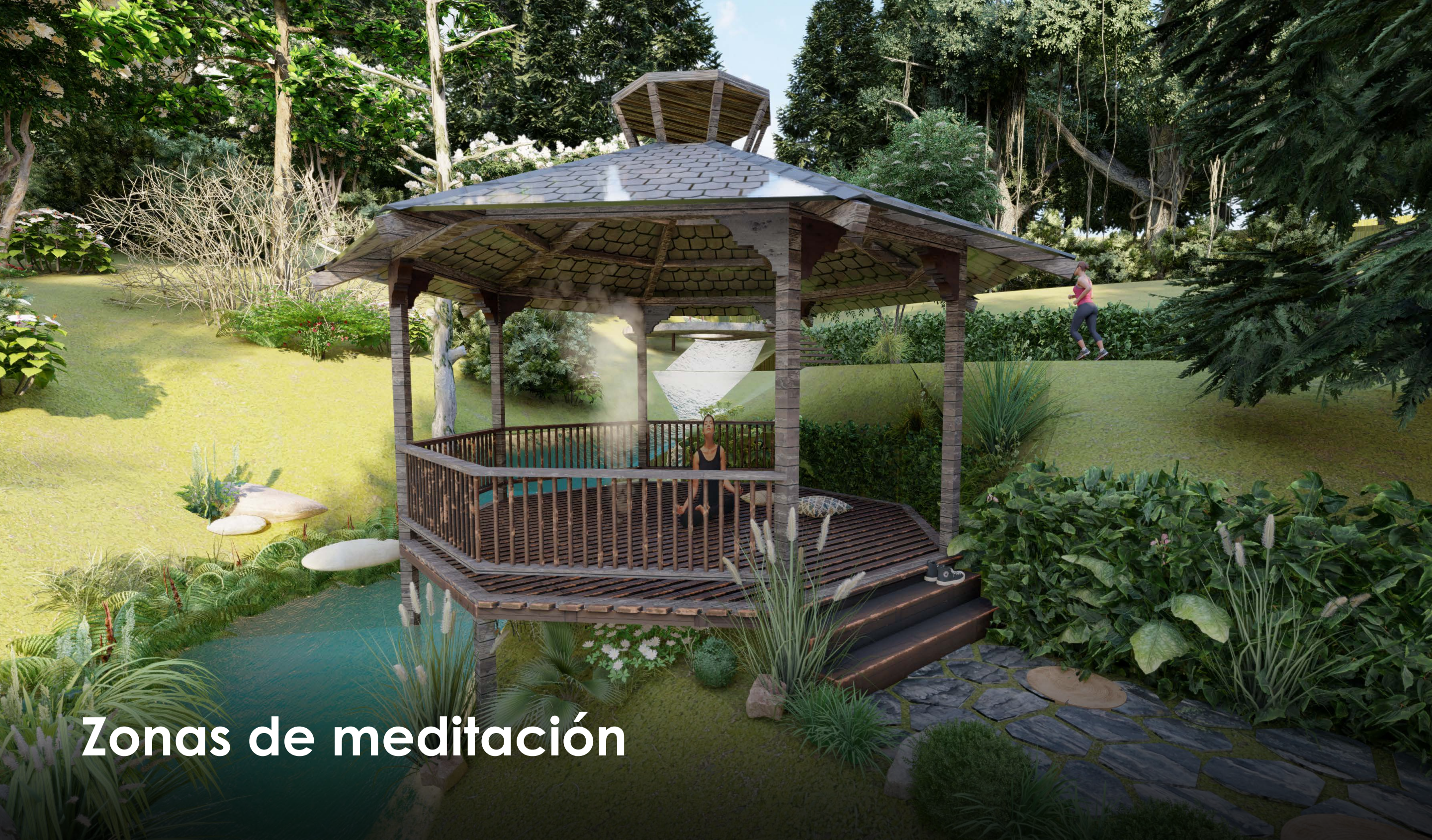
Zonas de meditación