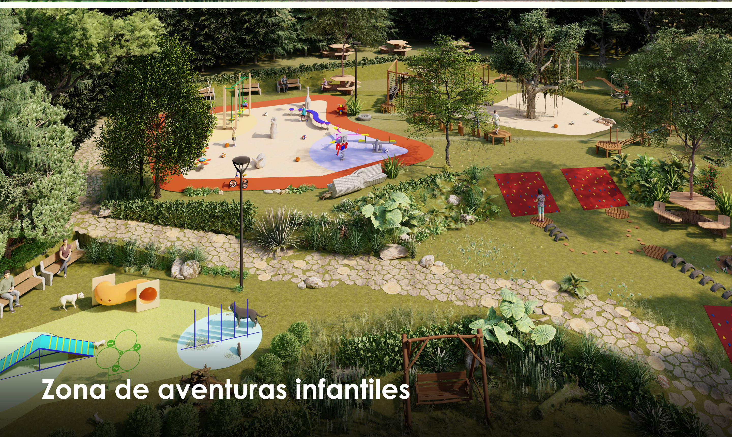
Zona de aventuras infantiles