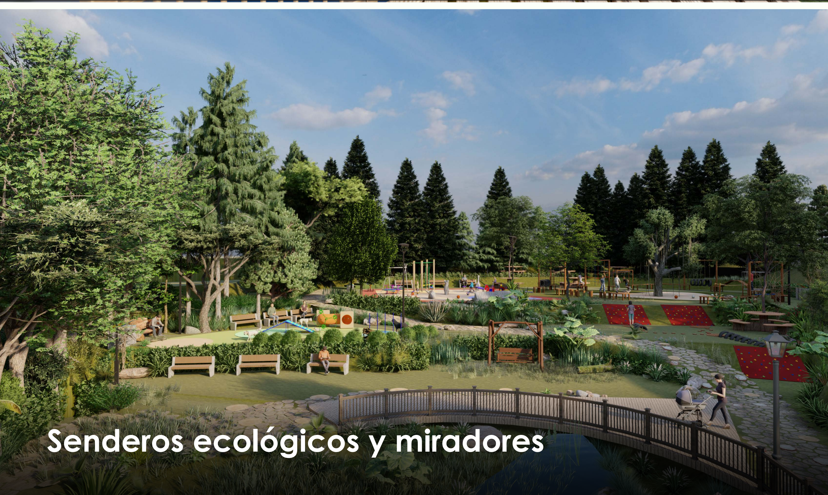
Senderos ecológicos y miradores