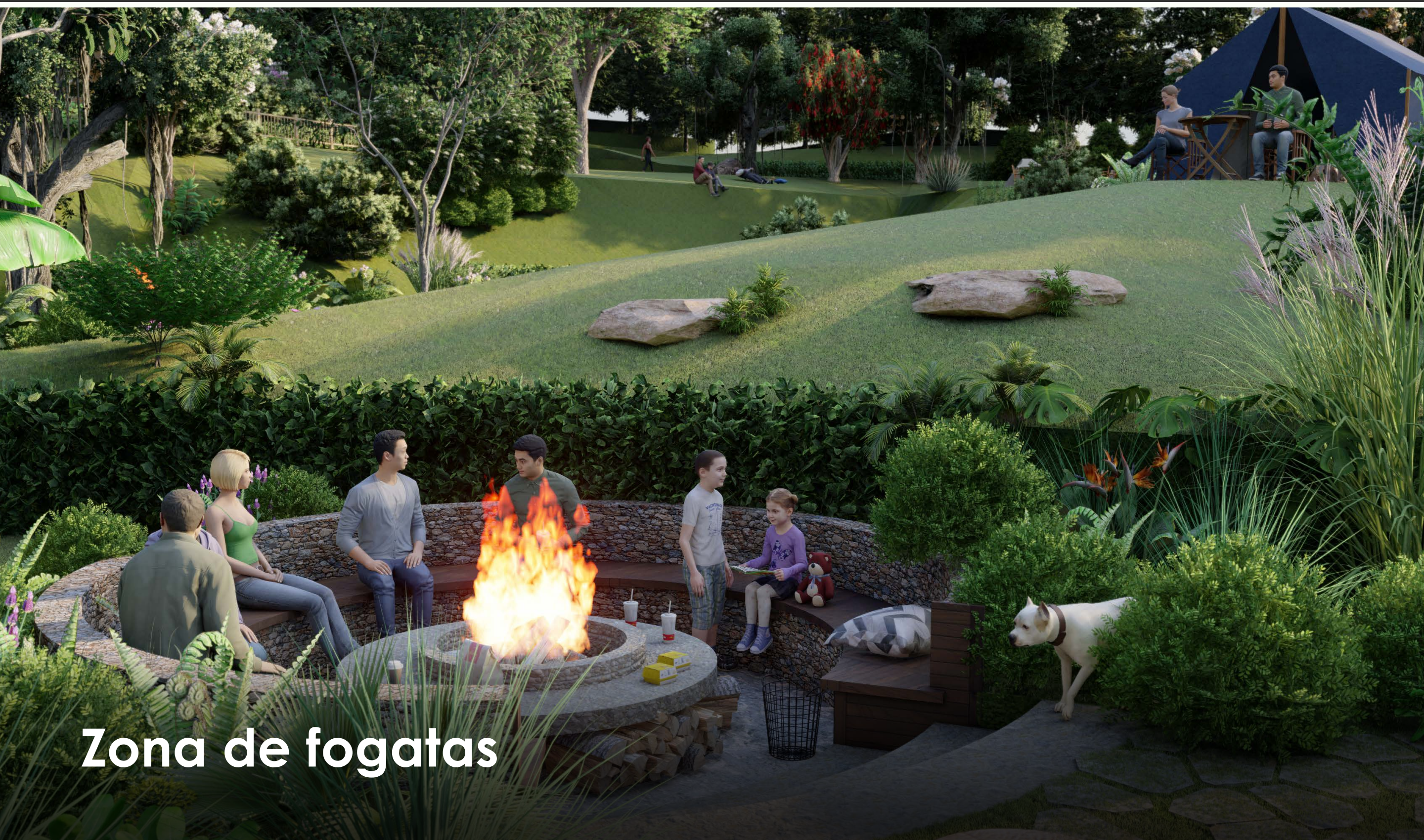
Zona de fogatas