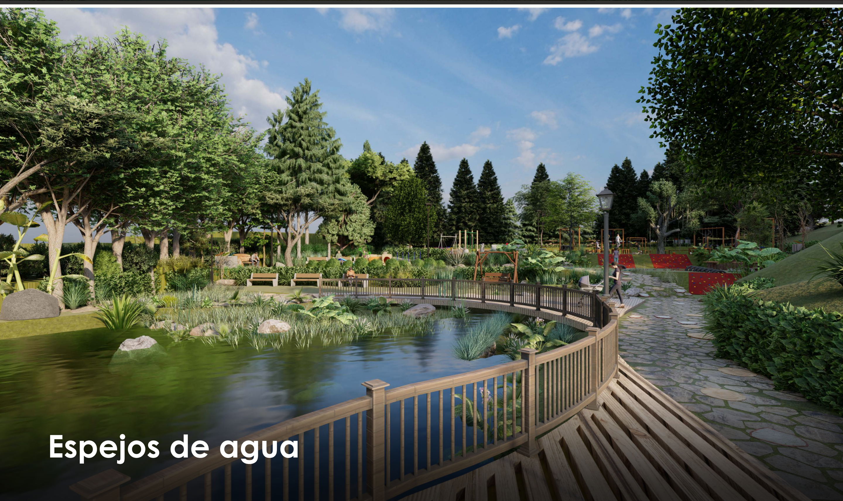
Espejos de agua