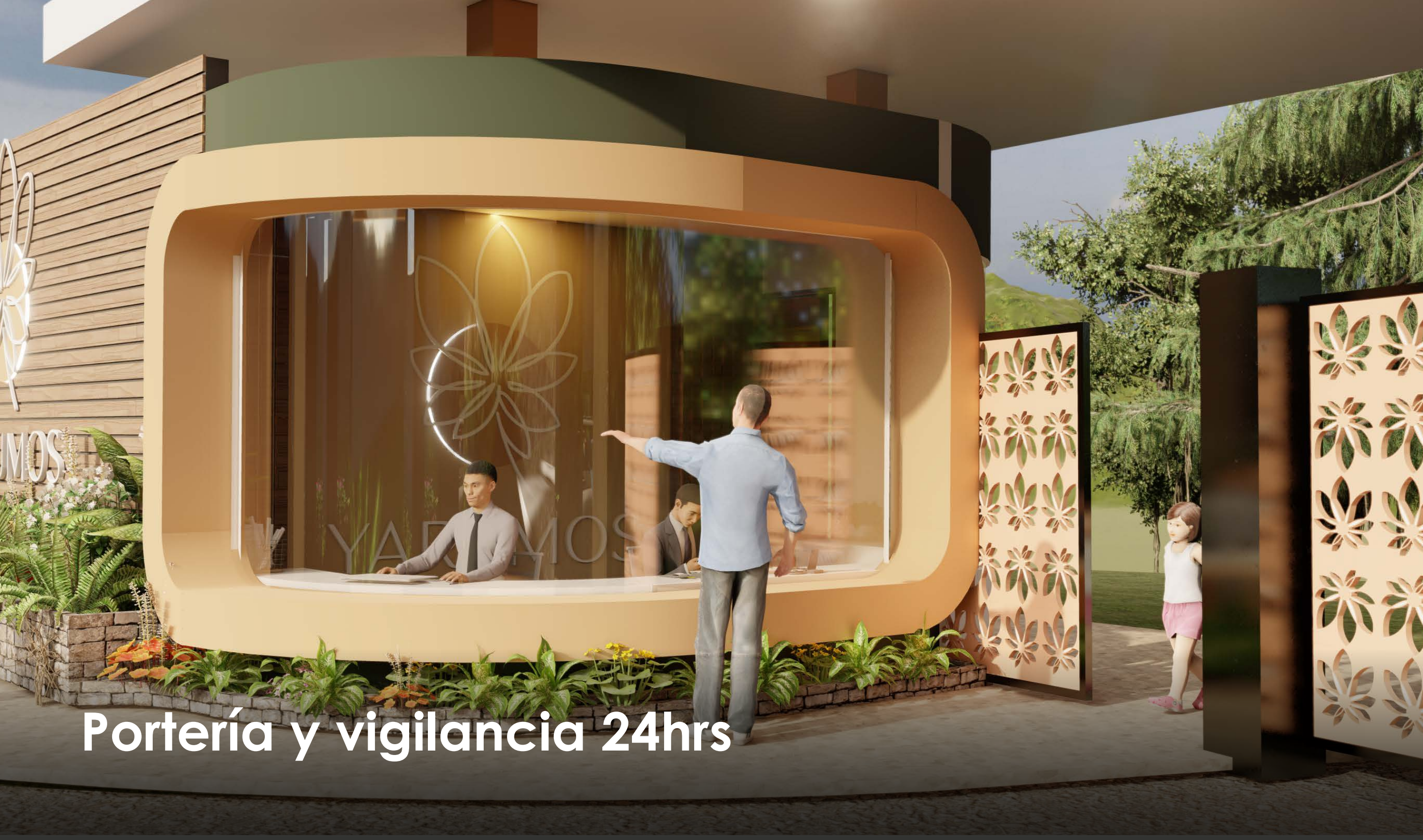
Portería y vigilancia 24hrs